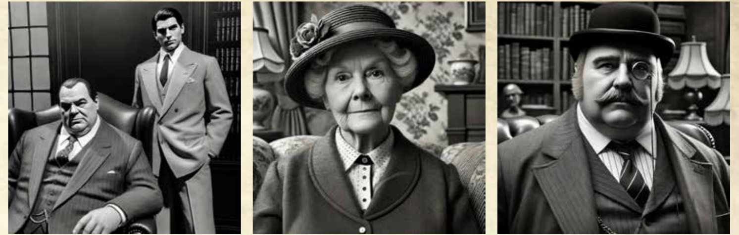
Kuvissa oikealta vasemmalle Nero Wolfe ja hänen apurinsa Archie Goodwin, Miss Marple, sekä Sir Henry Merrivale. Kuvat on luotu tekoälyllä.

Päällisin puolin jokainen salapoliisi oli selkeästi omanlaisensa. Siinä missä Nero Wolfe oli hieman hapan ja erakoituva introvertti, Sir Henry Merrivale oli taas persoonallisuudeltaan värikäs ja temperamenttinen ekstrovertti. Miss Marple oli käytökseltään hillitty, empaattinen ja lempeä kuten ehkä ikäneidon siihen aikaan odotettiin olevan. Kun lähdin sijoittamaan salapoliiseja erottelutyylin perusteella kartalle ja arvioimaan heidän päätöksentekoa ja ongelmanratkaisua, piirtyi heistä yllättävän samanlainen kuva.